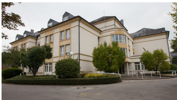
Maison Regina Pacis

L'association sans but lucratif MAREDOC est une institution privée dont l'objet est la gestion des Maisons de Retraite des Soeurs de la Doctrine Chrétienne au Luxembourg. Fondée en 1993, elle gère actuellement une structure d'hébergement pour personnes âgées qui offre l'hébergement à 140 personnes âgées et/ou nécessitant des soins :