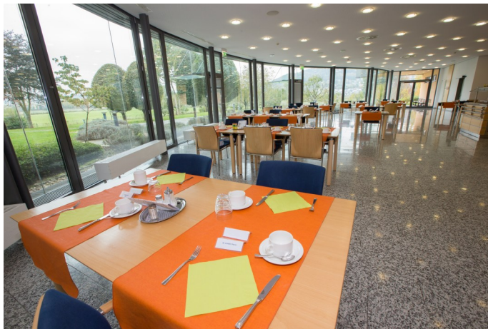
Restaurant Marie Consolatrice

Chacune des trois structures a son propre restaurant. Les repas sont pris au restaurant et l'aide est donnée aux résidents qui en ont besoin.