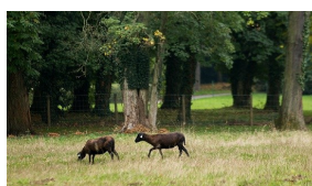
Divers animaux à la MAREDOC