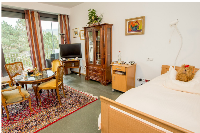
Exemple de logement

Vous pouvez personnaliser votre logement en apportant du petit mobilier, des éléments décoratifs et une télévision.