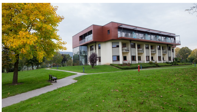
Maison Marie Consolatrice