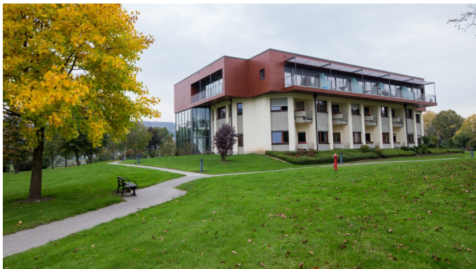
Maison Marie Consolatrice